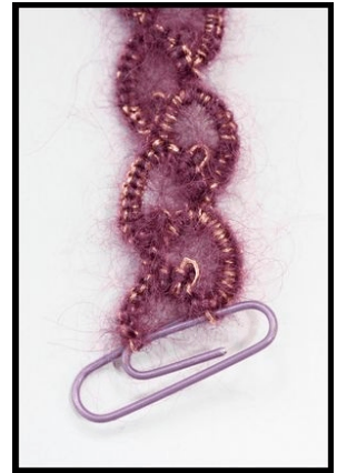
Bildene viser riktig størrelse i forhold til hverandre