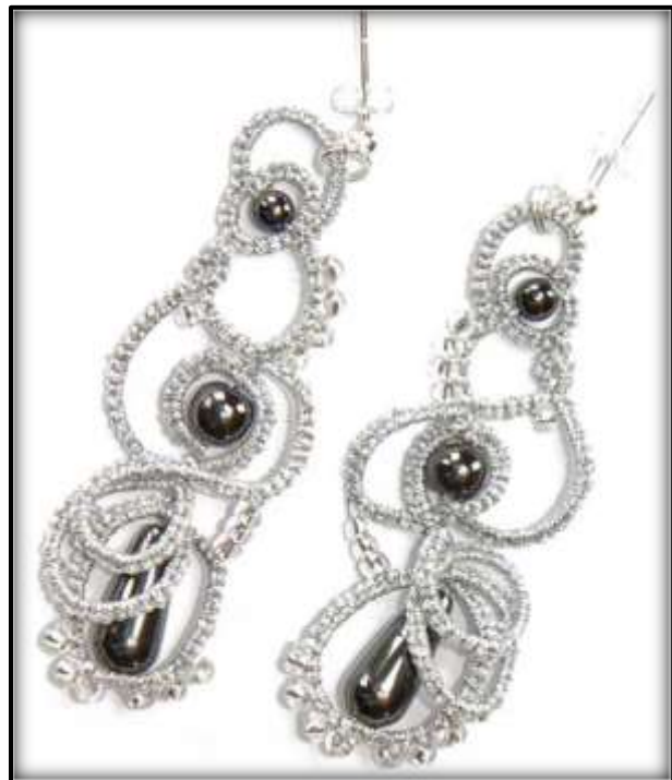
«Melange Earrings» Foto og arbeid: Merete H. Høidal