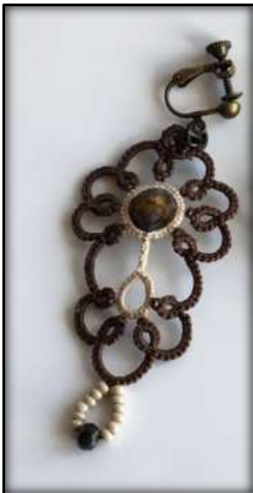
«Time & Again earrings» Foto og arbeid: Liv Øyen Strind