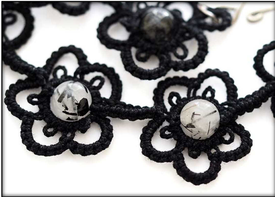
«Flower Chain Necklace» Foto og arbeid: Merete H. Høidal.

Eksempler på arbeid utført fra nuperellemønstre i boken: